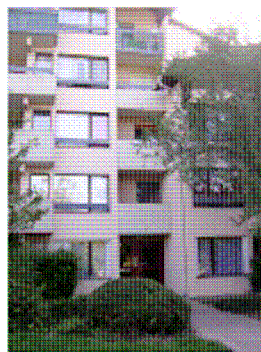
Travaux d'économie d'énergie